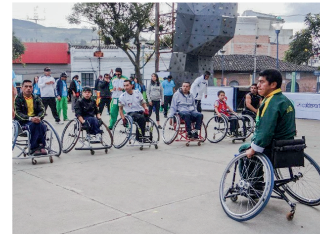
Figura 2 Egresado trabajando la inclusión en sus actividades.

Asimismo, es importante destacar que muchos licenciados en Educación Física, egresados de la UNICESMAG, se han convertido en valiosos líderes y gestores a nivel regional, nacional e internacional para generar un cambio social en favor de sus comunidades; algunos han tomado la decisión temprana a partir de sus trabajos de investigación en pregrado y seguir contribuyendo con el desarrollo y el impulso de oportunidades para estas personas, llevándolos a perfilarse por esos caminos de la educación inclusiva o del mismo deporte paralímpico.