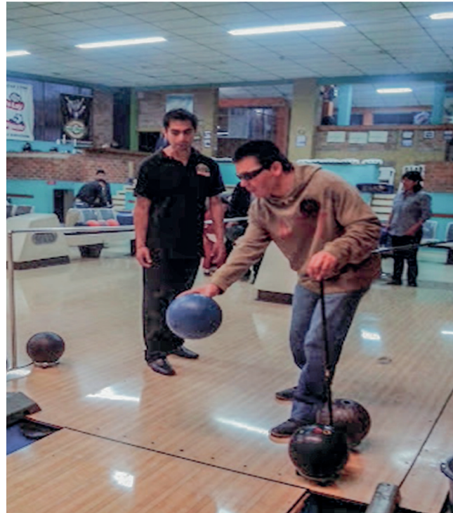
Figura 4 Orientación deportiva a deportista con discapacidad visual.

El estudiante, a través de la práctica pedagógica, ahonda en temas que hoy en día son de mucho interés, es el caso de la educación inclusiva que se la toma como justa y de calidad para todos. Surge del convencimiento de que la educación es un derecho humano básico que está en los cimientos de una sociedad más justa y se centra en todos los estudiantes, prestando especial atención a aquellos que tradicionalmente han sido excluidos de las oportunidades educativas, tales como los niños y jóvenes pertenecientes a las minorías étnicas y lingüísticas, los provenientes de sectores rurales alejados, niños, niñas y jóvenes de la calle, estudiantes con necesidades especiales y discapacidad, entre otros (Blanco, 2006).