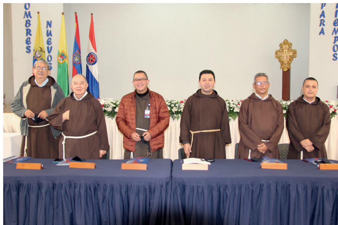
Integrantes del Consejo Máximo, Universidad CESMAG durante su toma de posesión. (Coliseo Guillermo de Castellana , 21 de octubre de 2021).