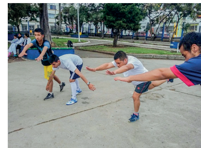
Figura 3 Prácticas deportivas con personas con discapacidad.

El educador físico es un profesional que está llamado a ser parte de grupos interdisciplinarios que estén a favor del bienestar integral de las personas con discapacidad, es probable que ni siquiera él mismo sea consciente de las estrategias y efectos tan positivos que puede lograr para esta población a partir de su labor profesional. Por esta razón, la práctica pedagógica con enfoque inclusivo que realice en sus procesos de formación se convierte en un aspecto fundamental para ampliar los campos de acción donde se puede desenvolver, además de ser un aspecto importante en la actualidad.