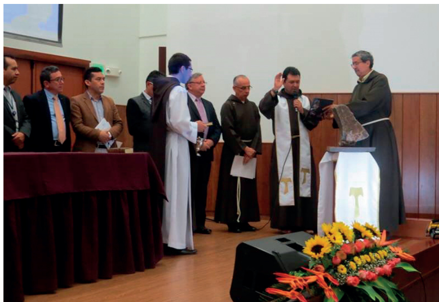
Bendición de la primera piedra de la futura obra San Damián en la población de Catambuco. (2013).