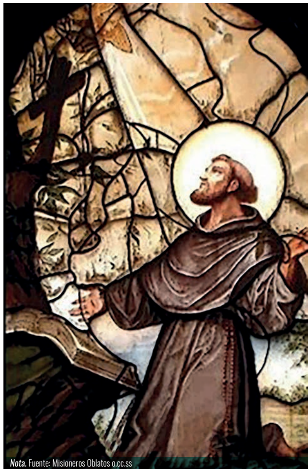
Figura 4 Padre Nuestro de San Francisco de Asís.

Recuerda que cuando abandones esta tierra, no podrás llevarte contigo nada de lo que has recibido, sólo lo que has dado