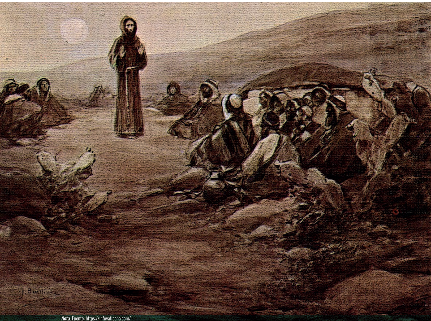
Figura 1 San Francisco de Asís.